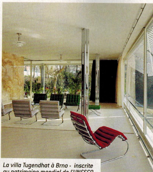
La villa Tugendhat à Brno - inscrite au patrimoine mondial de l'UNESCO.